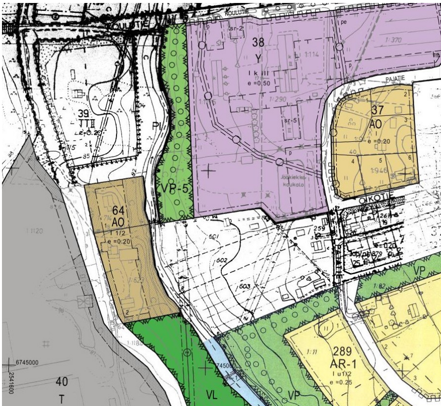
Kuva 3. Ote ajantasa-asemakaavasta. Suunnittelualue sijoittuu pääosin valkoiselle alueelle AO-, VP-5-, Y- ja VP- alueiden väliin. Koulun kiinteistön osalta suunnittelualue on osoitettu Y-alueena.